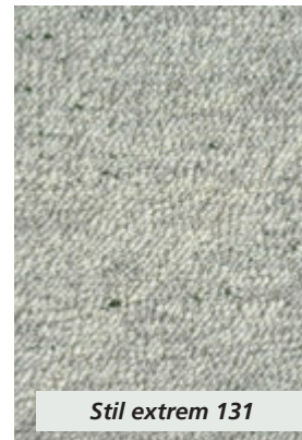
Stil extrem 131