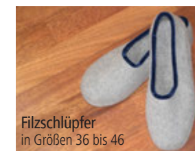
Filzschlüpfer in Größen 36 bis 46