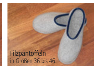
Filzpantoffeln in Größen 36 bis 46