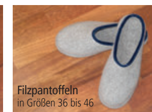
Filzpantoffeln in Größen 36 bis 46