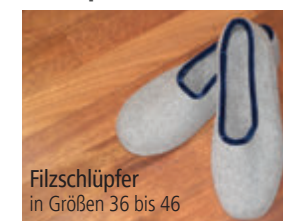
Filzschlüpfer in Größen 36 bis 46