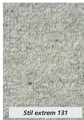
Stil extrem 131